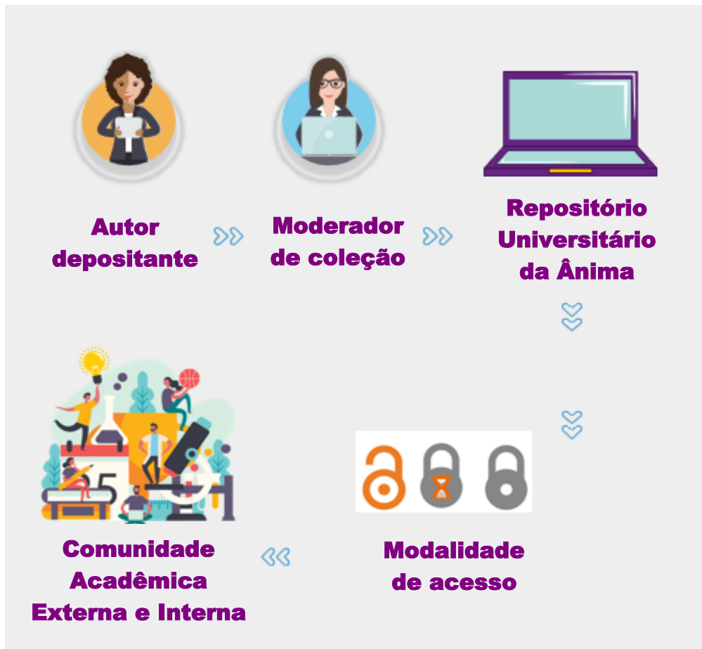
Figura 1- Macroprocesso do Repositório