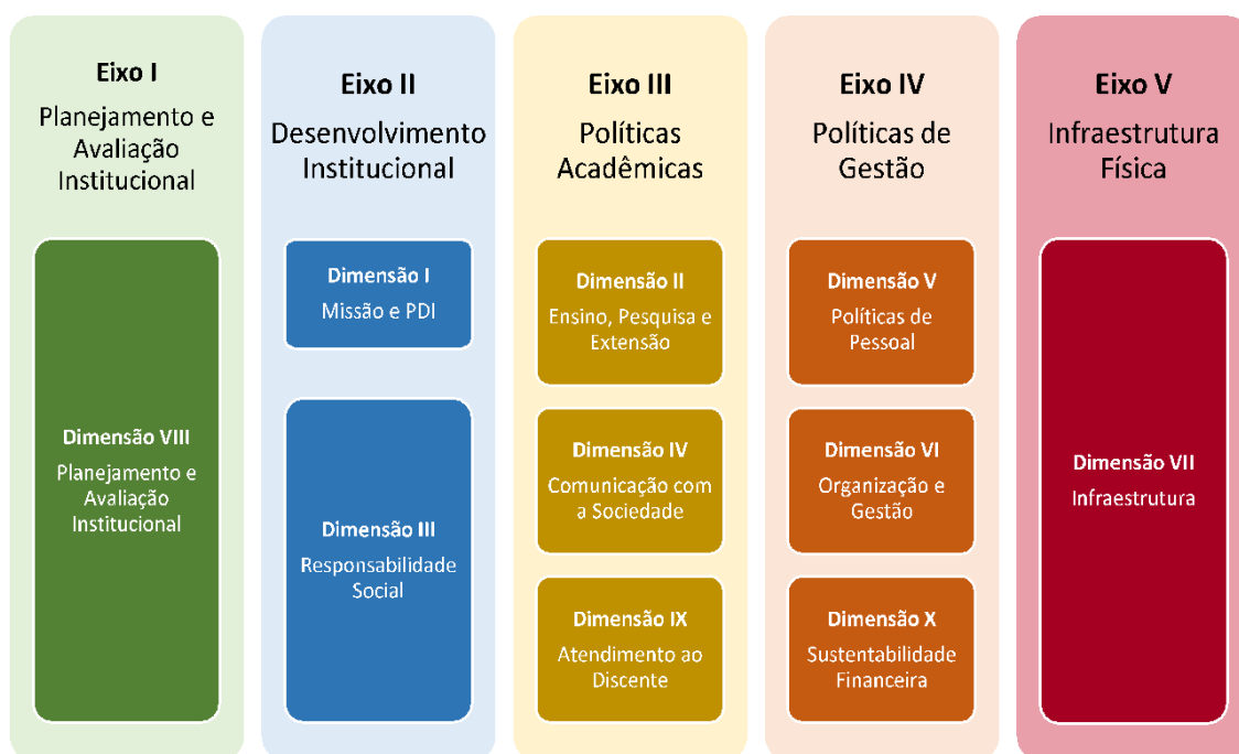
Figura 2 – Eixos e dimensões do SINAES

Essa autoavaliação, realizada em todos os cursos da IES, a cada semestre, de forma quantitativa e qualitativa, atende à Lei do Sistema Nacional de Avaliação da Educação Superior (SINAES), nº 10.8601, de 14 de abril de 2004. A legislação prevê a avaliação de dez dimensões, agrupadas em 5 eixos, conforme ilustra a figura a seguir.