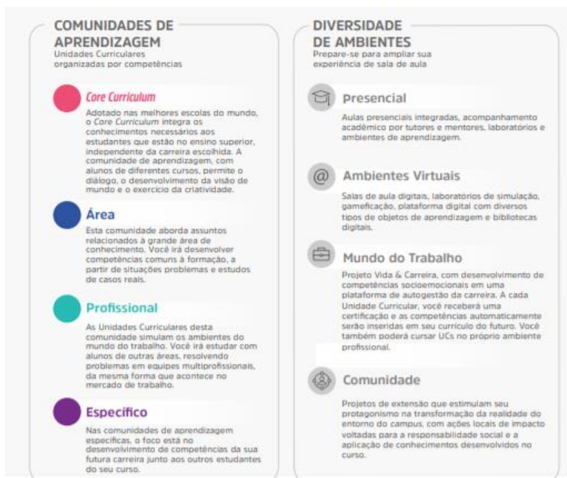
Figura 1 – Comunidades de aprendizagem e diversidade de ambientes

Assim, durante o seu percurso formativo, o estudante desenvolve, de forma flexível e personalizada, conforme perfil do egresso, as competências, conhecimentos, habilidades e atitudes de trabalho em equipe, resolução de problemas, busca de informação, visão integrada e humanizada.